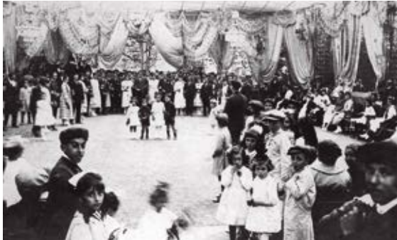
Autor desconegut. Envelat Roser de Maig, dècada de 1920. Arxiu Municipal. Cedida per Maria Cristina Morera

L'any passat recordàvem l'origen de la Festa Major del Roser de Maig a Cerdanyola i com, des del segle XVI, la celebració de la devoció del Roser havia anat prenent importància dins del calendari festiu local. Enguany ens acostarem a la història de la celebració del Roser de Maig al segle XX.