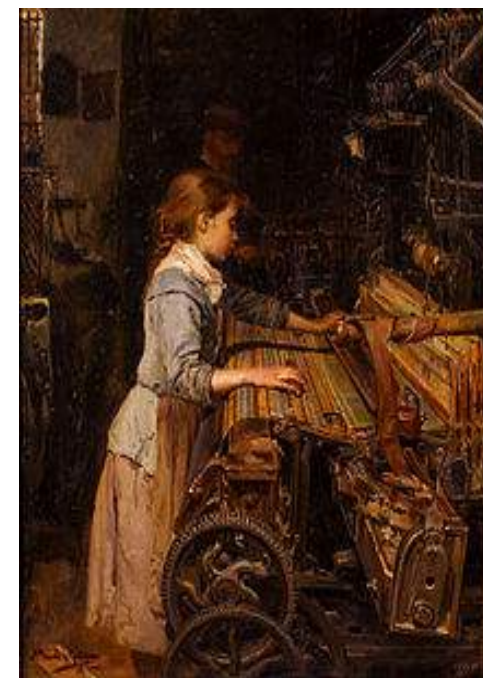
La nena obrera (Joan Planella) 1884

L'eix central de la proposta és la producció d'imatges audiovisuals que donin comptes de la vida de les persones del Vallès. Sent una comarca marcada pel desenvolupament industrial, tot el relatiu al treball i la indústria serà el centre del projecte. No obstant això, no volem limitar-nos als entorns fabrils o a les qüestions sindicals o tecnològiques. Els ritmes i destins privats estan també relacionats profundament amb el treball i la indústria: des del cansament per les hores d'esforç fins a les íntimes conseqüències de les crisis econòmiques. Tampoc volem només descriure un estat de la qüestió: ens interessa explorar la història, establir nexes i conseqüències entre l'abans i el després. Per aquest motiu, per exemple, com a imatge històrica emblemàtica sobre la qual treballar hem escollit "La nena obrera" pintada per Joan Planella el 1884. Aquest esplèndid quadre, que retrata una nena treballant a un telar automàtic en una fàbrica, està representat en el mNACTEC on es conserva un telar idèntic. La pintura podria haver-se inspirat en la realitat de qualsevol fàbrica del Vallès de l'època. L'obra té també paral·lelismes amb moltes situacions actuals al món. Una de les dues versions de l'obra es conserva al Vallès mateix.