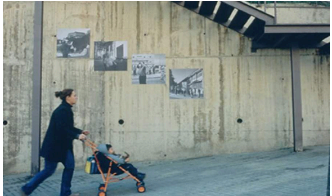
Visions del Carmel (Claudio Zulian) 2003

Finalment, el conjunt de les instal·lacions sonores i videoinstal·lacions de tots els llocs, podran veure's en forma d'exposició a La Virreina Centre de la Imatge a Barcelona, entitat que també participa en la producció de Vallès: fabricar passats, fabricar futurs .