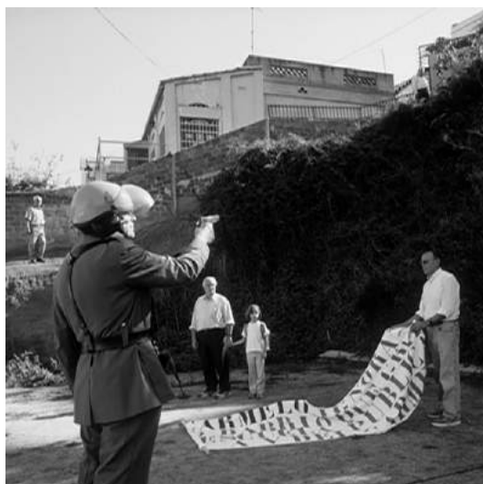
Visions del Carmel (Claudio Zulian) 2003

2. LES VEUS I ELS SONS. Uns senzills dispositius d'àudio reproduiran frases curtes i/o sons, tot relacionat amb la temàtica del projecte, la història i la imaginació del futur de Cerdanyola. S'instal·laran en diferents punts de la ciutat.