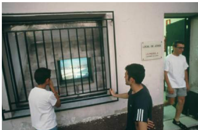
Finestra de magraners (Claudio Zulian) 2000

4. INTERIORS. A algunes cases relacionades amb diferents moments de la història de la ciutat, es rodaran curtes escenes significatives – reconstruccions històriques, moments del present, imaginacions del futur - que seran mostrades després de manera adequada - obrint la casa a hores determinades, utilitzant les finestres com pantalles, etc. – interpretades, si és possible, pels mateixos habitants de la casa. Es representaran així diferents moments de la història íntima de Cerdanyola del Vallès.