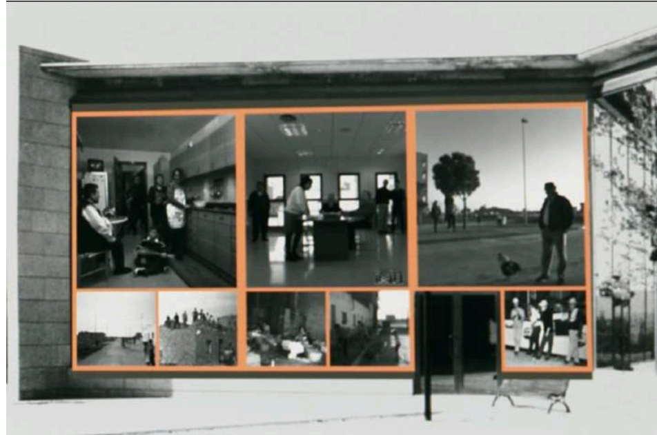
El retaule de Secà de Sant Pere (Claudio Zulian) 1999 – Centre cívic del Secà de Sant Pere (Ajuntament de Llèida)

En tots els casos, intentarem, en la mesura del possible, que els personatges i figurants de les escenes que rodarem siguin habitants del lloc i, a poder ser, persones lligades per història familiar o per interès a les històries que volem representar. D'aquesta manera l'acte de memòria i imaginació en què consisteix l'obra visibilitzarà sèries concretes d'històries i filiacions en el Vallès, i tindrà també ressonàncies concretes personals entre els seus habitants.