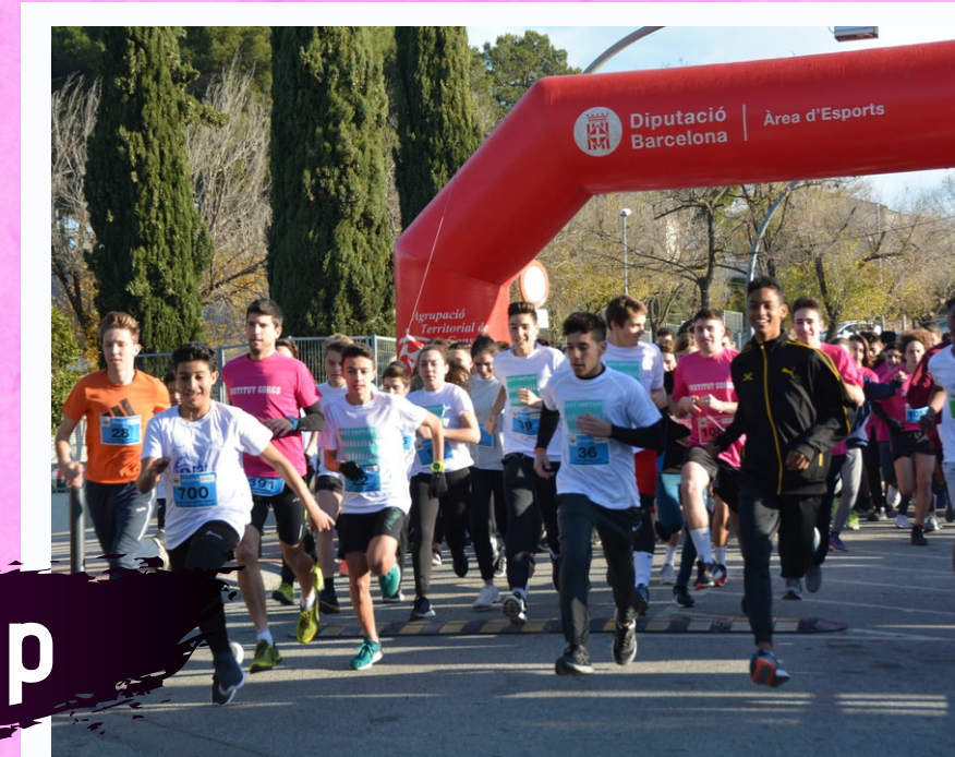
Dorsal i xip