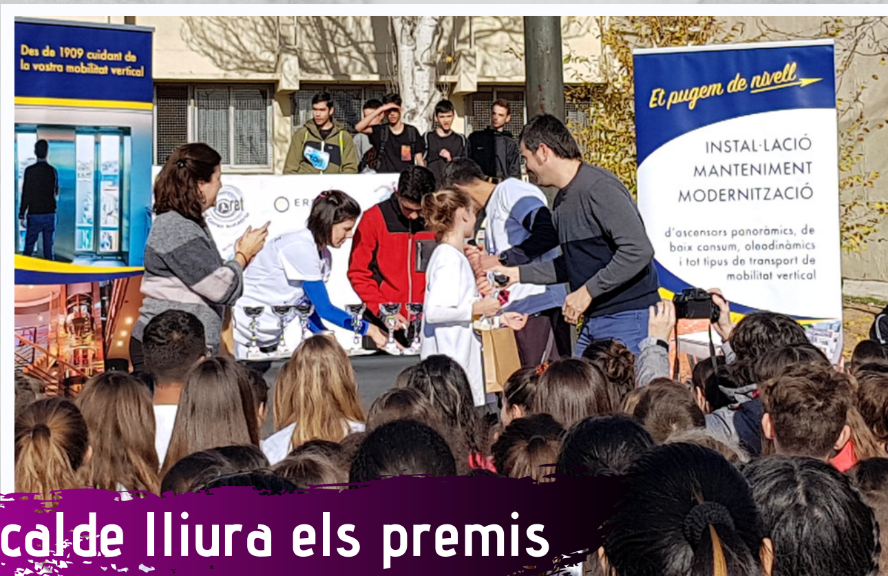
L'alcalde lliura els premis