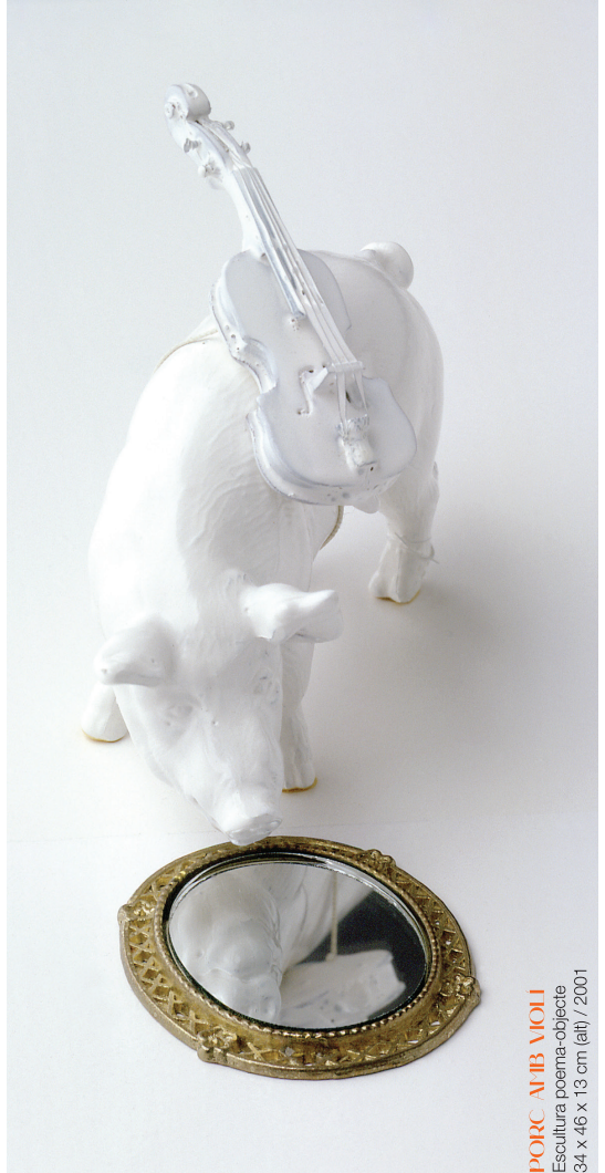
PORC AMB VIOLI Escultura poema-objecte 34 x 46 x 13 cm (alt) / 2001