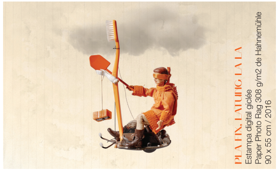
PLATIN, LATUNG LA LA Estampa digital giclée Paper Photo Rag 308 g/m2 de Hamamühle 90 x 55 cm / 2016